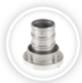
STORZ KOPPELING P128