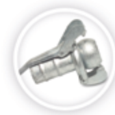
BAUER KOPPELING P94