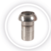
PERROT KOPPELING P111