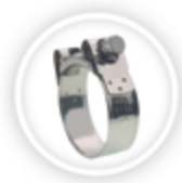
SUPRAKLEM W2 P194