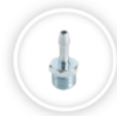
ORION SLANGTULE P168