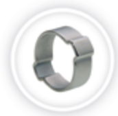
2-OOR SLANGKLEM P193