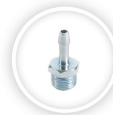
ORION SLANGTULE P181