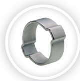
2-OOR SLANGKLEM P204