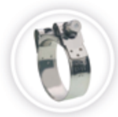
SUPRAKLEM W2 P194