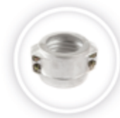
RVS KLEMSCHAAL P191