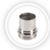
KLEMSCHAAL TULE P157