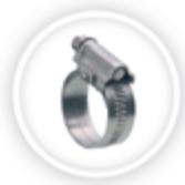
RVS SLANGKLEM P195