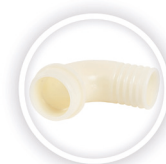
NYLON SLANGPILAAR P192