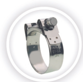
SUPRAKLEM W2 P205