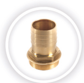
MESSING VAAREIND P197